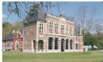
Domein de Ghellinck Kortrijkstraat 74 (GPS: 110)