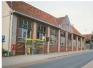
Feestzaal Gemeentehuis Waregemseweg 35