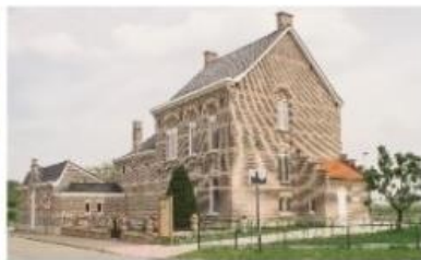
Schoolke Moregem Moregemplein 28