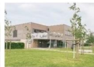
Sporthal De Ruffel Nellekensweg 1