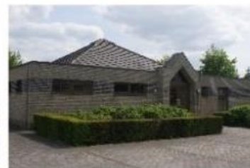
OC Rozenhof Rozenhof 126