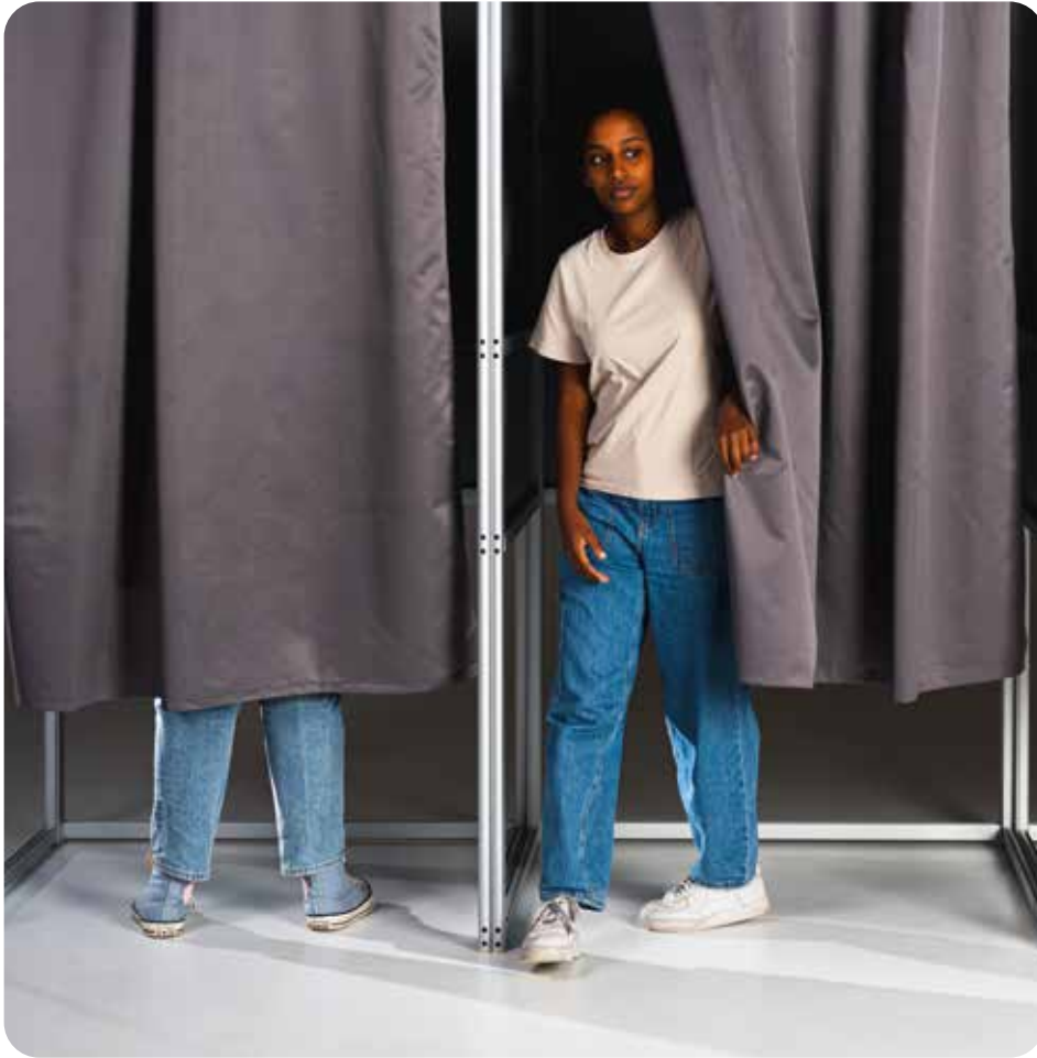
© 't Is aan u! - Lien Notebaert